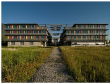
Les locaux de l'Agence Savoie à Technolac au Bourget-du-Lac

La possibilité d'accès à l'actionariat de l'entreprise pour l'ensemble des salariés