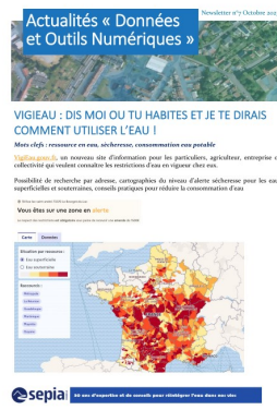
Exemple de newsletters produites par le groupe métier Outils Numériques de SEPIA