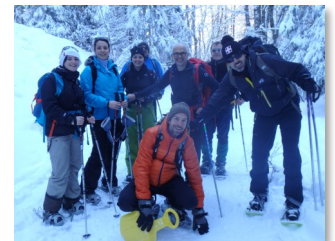
Séminaire annuel avec l'ensemble des équipes de SEPIA Conseils